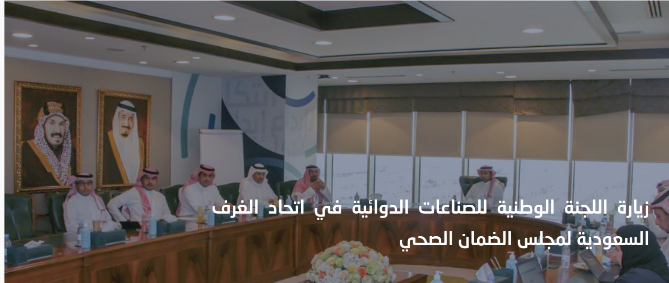
زيارة اللجنة الوطنية للصناعات الدوائية في اتحاد الغرف السعودية لمجلس الضمان الصحي