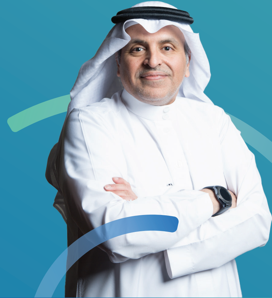
د. شبيب الفهمدي الأمين العام لمجلس الضمان الصحي

وختاماً أوجه بالغ الشكر لجميع منسوبي المجلس على جهودهم الجلية خلال الفترة السابقة في سبيل تحقيق هذه الإنجازات، راجين الله أن تسعى هذه التطورات في تمكين قطاع التأمين الصحي الخاص في المملكة.