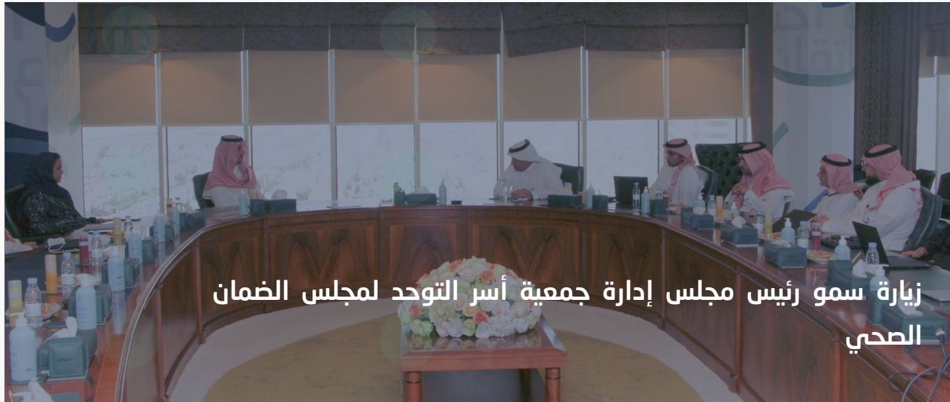
زيارة سمو رئيس مجلس إدارة جمعية أسر التوحد لمجلس الضمان الصحي