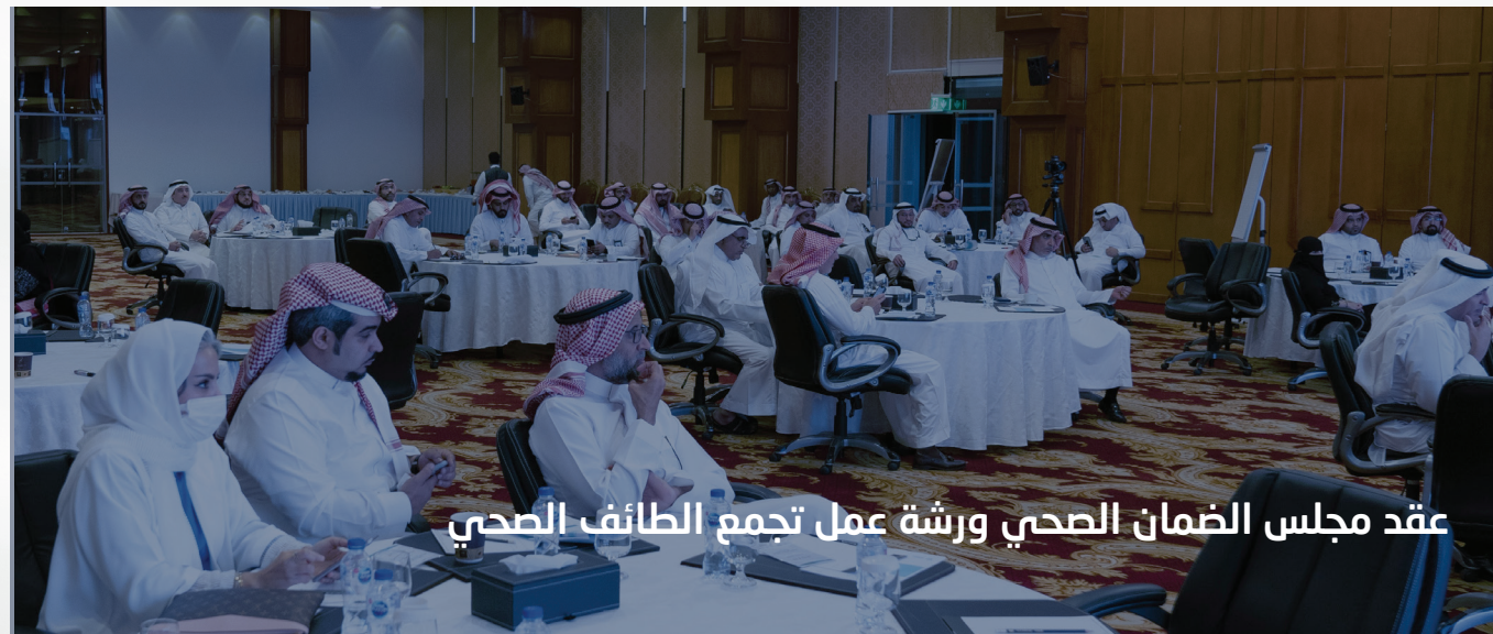
عقد مجلس الضمان الصحي ورشة عمل تجمع الطائفت الصحي